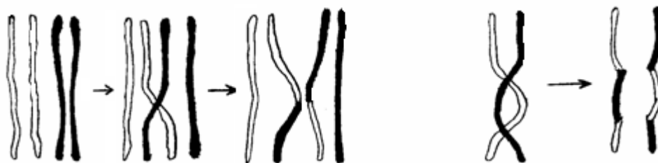
Fig. 1 – Schema di chiasma fra cromosomi nel corso della meiosi

Durante la meiosi, il corredo diploide delle cellule progenitrici dei gameti (oociti e spermatociti, globalmente chiamati gametociti ) non viene diviso in due metà nette (metà cromosomi, quelli materni, in un gamete; l'altra metà, i paterni, nell'altro): vi può essere un certo grado di rimescolamento. Ma non è tutto qui, ed ecco la sottigliezza. In un certo momento della meiosi, due cromosomi omologhi, cioè uno materno ed uno paterno nella stessa coppia, aderiscono fra loro per la lunghezza ed eventualmente si incrociano come se si incollassero in uno o più punti; quando i due omologhi si separano per la divisione del gametocita in due gameti aploidi, i due cromosomi originati dalla separazione possono risultare misti, cioè contenere parte del cromosoma materno e parte del paterno; è come se, nei punti di incrocio (" chiasmi " o " crossing-over "), i cromosomi si spezzassero, gli stessi pezzi per i due cromosomi della coppia e, dopo la divisione, i pezzi di un cromosoma si potessero riattaccare ai pezzi mancanti che provengono dall'altro cromosoma. Il numero di incroci (crossing-over) è naturalmente variabile; con un solo incrocio i due cromosomi si spezzano in due parti ognuno (fig. 1 a sinistra); con due incroci si hanno tre parti (fig. 1 a destra), ecc. Nella fig. 1 sono indicati in nero i cromosomi materni, in bianco quelli paterni e si mostrano i cromosomi prima e dopo la divisione.